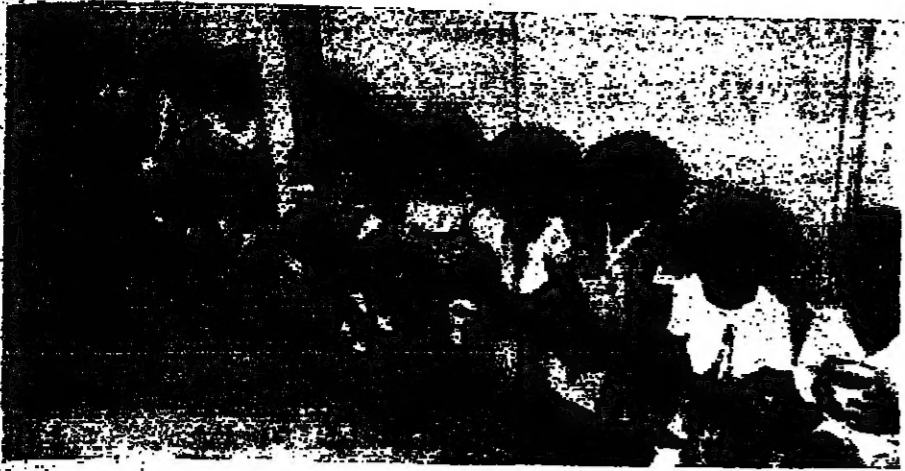
الاجتماع .. بشرون وبنون

غان ميمتا اصرت على التخليص القريبة قط ، بانتظار ما ستؤول اليه حالة الموازنة . تروي غيرها وهي عطشى ورشعين التي تروي القري المجاورة هي بدورها عطشى . ويعود ذلك كما يقول رئيس لجنة مياه رشعين موزيس مريسي الى المثل في حياض الصيغة الرئيسة ، وقد تعرض للتصفية ، كما ان « الانوارات » في المركز الكمي والحاجة الى تنقية ، اذ لم تجد تسخ بالسرعة اللازمة لتدبير المياه للجميع . عاد النشاط التطورات في المياه الضخمة يبعث الامل في الرشعين .. للتشاور بين الرشعين والرشعين في رشعين ، والتي عاد الى سابق عهده ، بعد ان تشكلت التوازي والتخصصات للبناء التي تضم شباب البلدة المتخصصين على اعمق الشرائح . تتفحص الشؤون والشهادات ، تقوم على صياغتهم ، وخلق روح الحية والكتابة بين الجميع هي من مهامهم . ورشعين التي كتبت من انفسها ساحة التي اصبحت خط السلام القشود بين قضاء زغرب وقضائية طرابلس . ونظرا لما كانها كما دخلنا وكان الحسب لم ندر فيها . بول جيميتاني